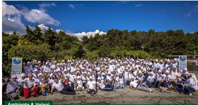
Ambiente & Veleni